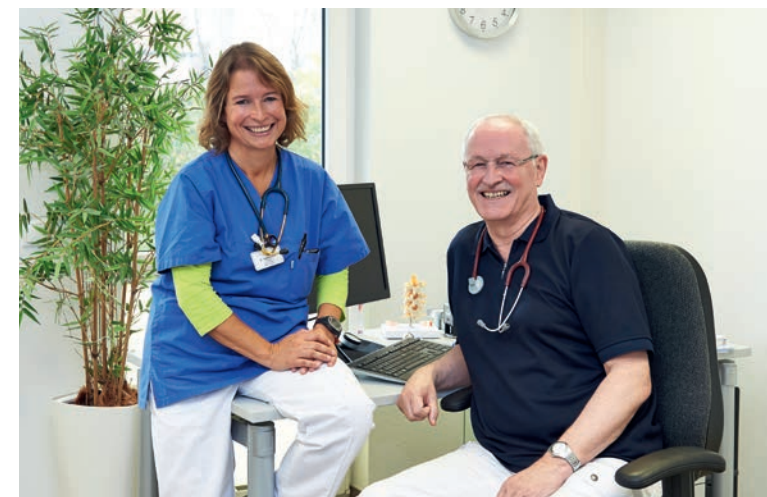
Dok.-Nr.: BK-PI-79