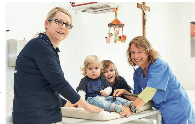
Dok.-Nr.: BK-PI-80 | Fotos: Hanschke Fotografie