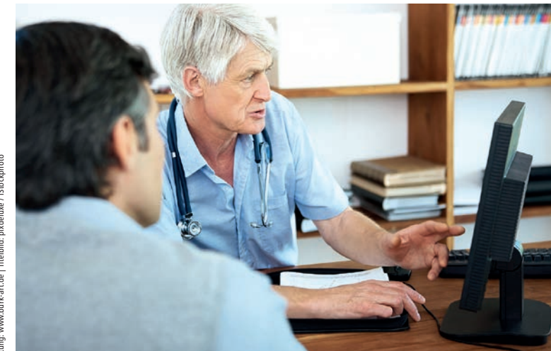
Stand: Juli 2019 | Gestaltung: www.burk-art.de | Titelbild: pixxeluxe / iStockphoto