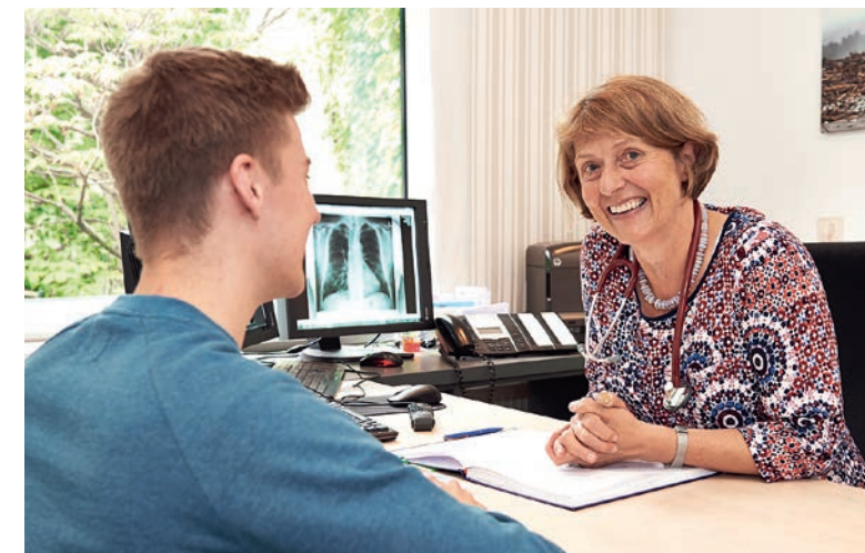
Dok.-Nr. BK-PI-76 | Fotos: St. Bernward Khs./Hanschiele Fotografie