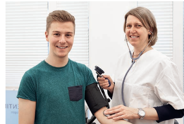
Dok.-Nr. BK-PI-74